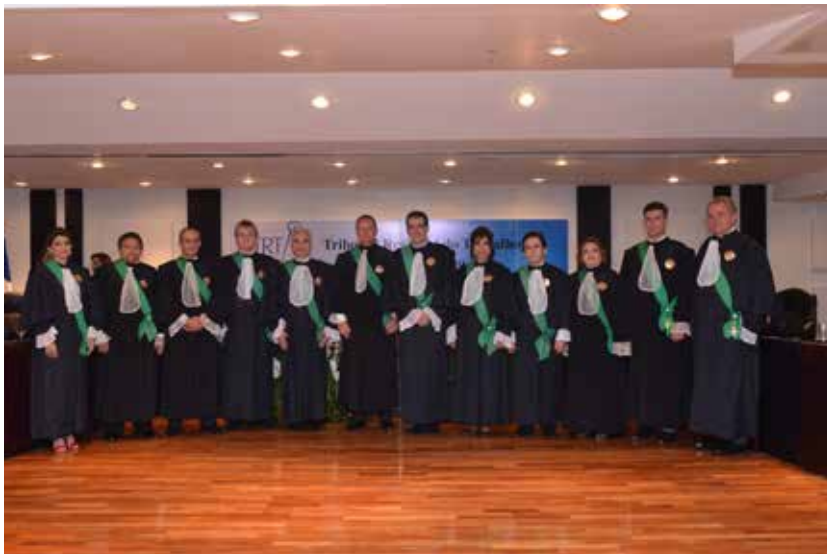
Foto: Cerimônia de posse dos novos dirigentes do TRT/18ª Região para o biênio 2015/2017